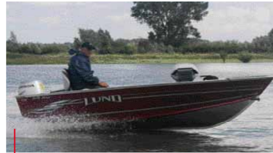
Het 'instapmodel' in actie.