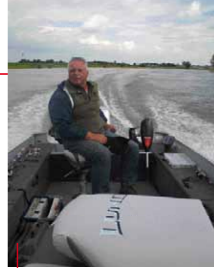
De boot stuurt opvallend gemakkelijk.